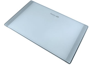
Planche de découpe en verre 8633 300